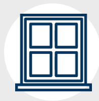
Carpintería en aluminio