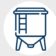
Limpieza de tanque