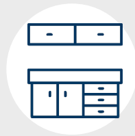
Carpintería en madera