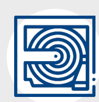
Sistema contra incendio